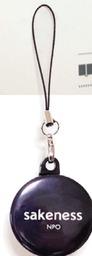
ストラップ 希望小売価格 ¥350 (税込)